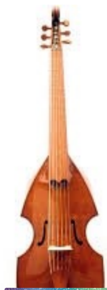
Viola da Gamba